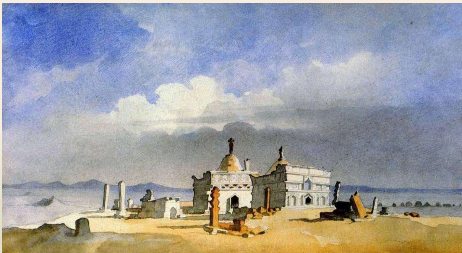
Туркменські Аби в Каратау