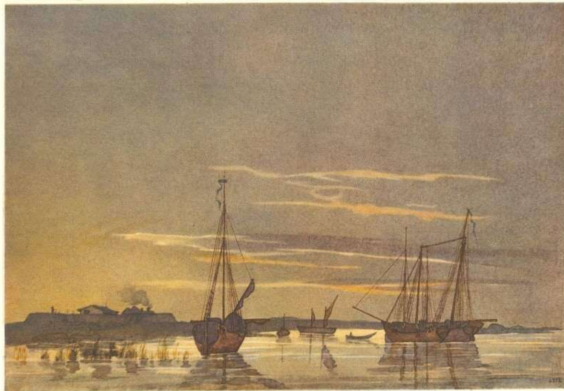
32. ШХУНИ БІЛЯ ФОРТУ КОС-АРАА. Акварель. [6.X 1848—6.V 1849].