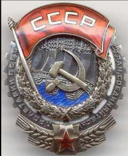
Орден Трудового Червоного Прапора