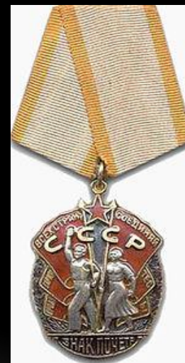
орден "Знак Пошани"