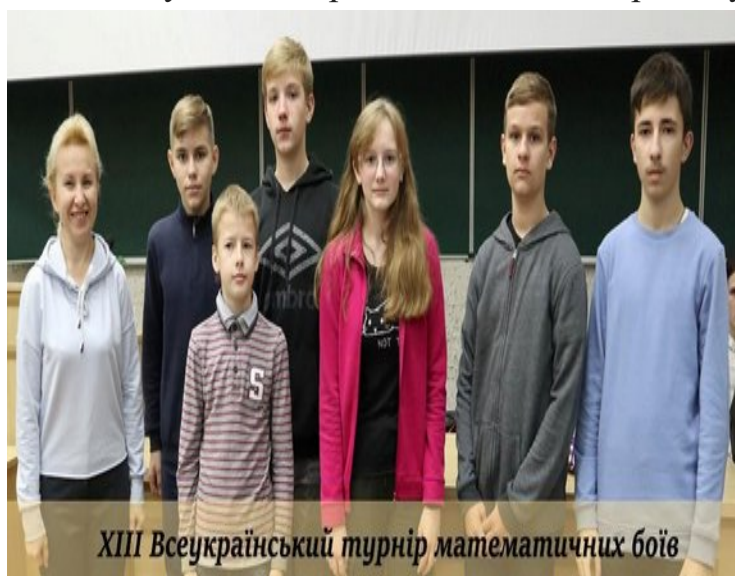
XIII Всеукраїнський турнір математичних боїв